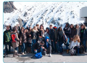
frz. spr. Schweiz