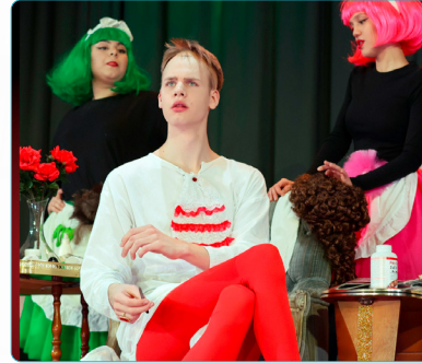
Theater: Der eingebildete Kranke - Molière