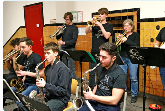
Kermits Big Band