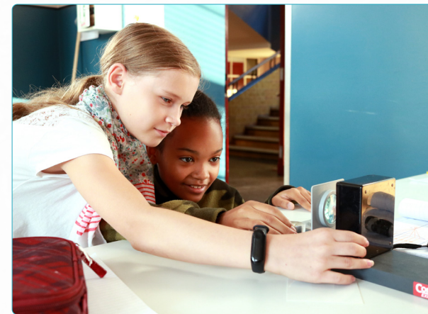
Von Schüler:innen selbstständig geplante Versuchsdurchführung mit Auswertung und Reflexion

Konsequenter Computereinsatz: Eine Klasse nutzt die eigenen Tablets , die Parallelklasse die schuleigenen Computer