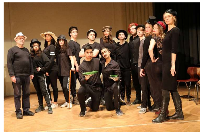
THE IMPORTANCE OF BEING EARNEST (2019)

Theater sollte nicht aus Verlegenheit gewählt werden, sondern aus Leidenschaft und als bewusste Entscheidung für eine ganz andere Arbeit an der Schule, die aber auch mehr und anderes von dir abverlangt.