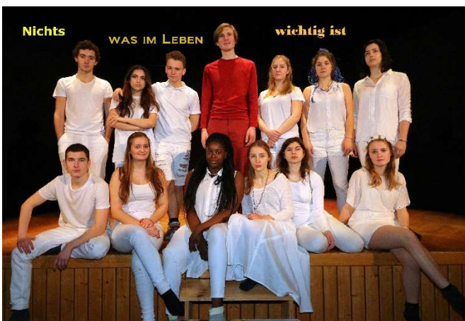
NICHTS, WAS IM LEBEN WICHTIG IST (2016)