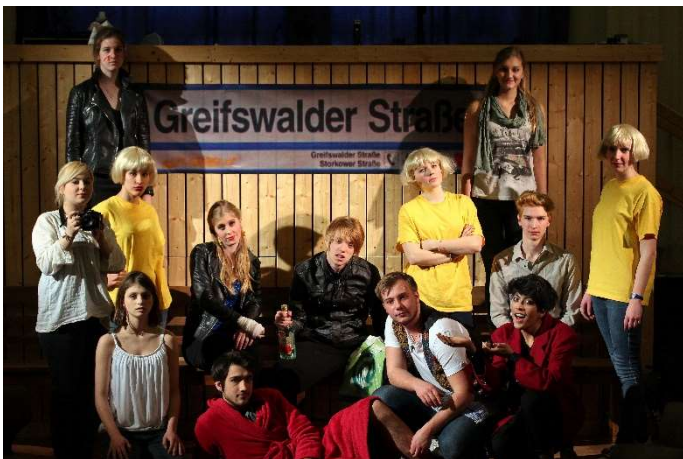
AUF DER GREIFSWALDER STRASSE (2014)

Theater kann als 5. Prüfungskomponente im Abitur gewählt werden. Die Aufgabentypen können sehr unterschiedlich sein. In jedem Falle werden aber kreative Umsetzungen nach bestimmten ästhetischen bzw. theoretischen Prinzipien und Kriterien eine Rolle spielen.