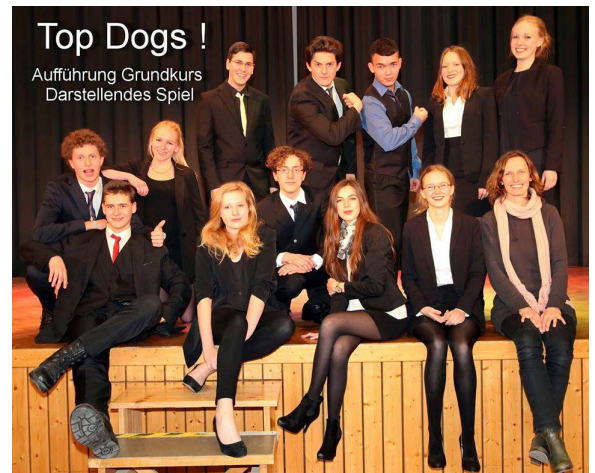
TOP DOGS (2015)