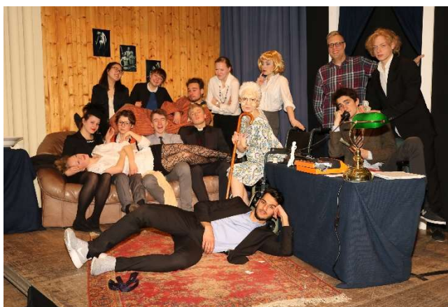
STERBEN FÜR ANFÄNGER (2018)